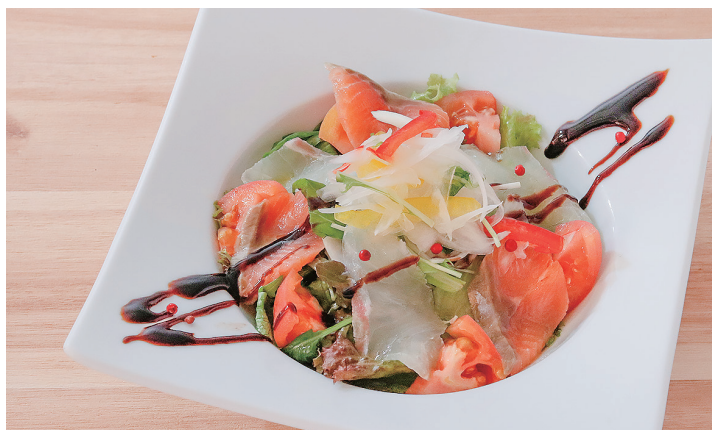
カルパッチョサラダ