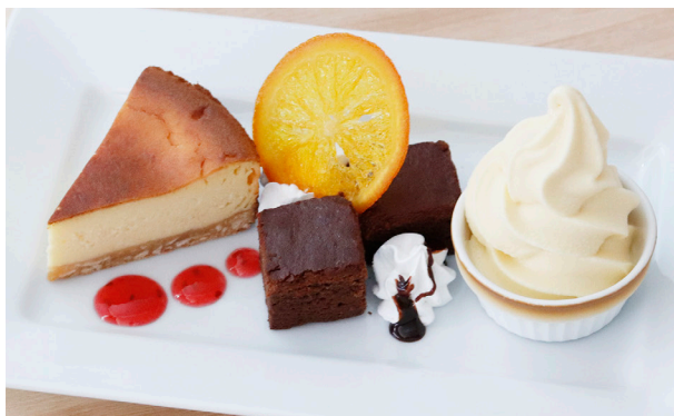
デザート盛り合わせ