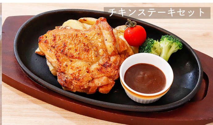
チキンステーキセット