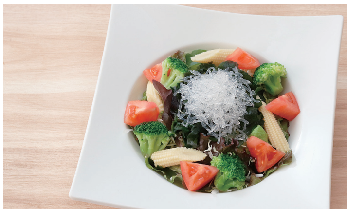
ヘルシーぷちぷちサラダ