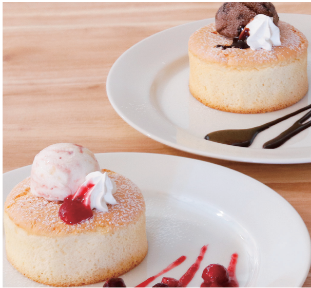
スフレパンケーキ