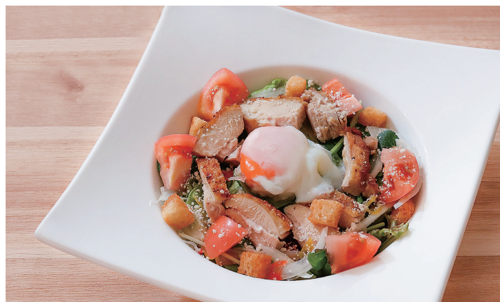
温玉チキンサラダ