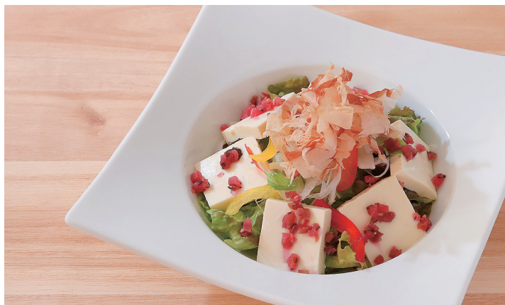
豆腐と梅のサラダ