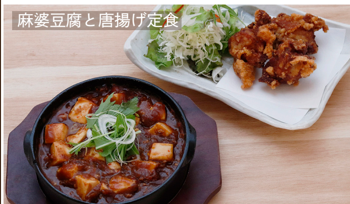
麻婆豆腐と唐揚げ定食