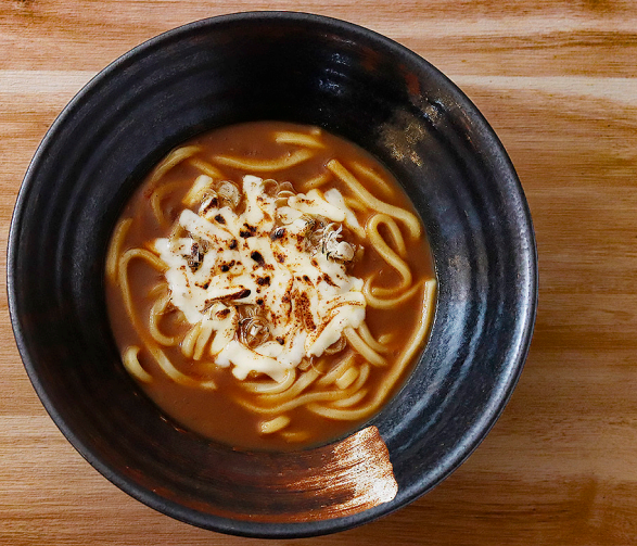
ネギとチーズのトッピング 相性抜群